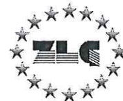
MEDCERT Zertifizierungsstelle (Dr. Andreas Schich)

Benannt durch/Designated by Zentralstelle der Länder für Gesundheitsschutz bei Arzneimitteln und Medizinprodukten www.zlg.de ZLG-BS-237.10.15